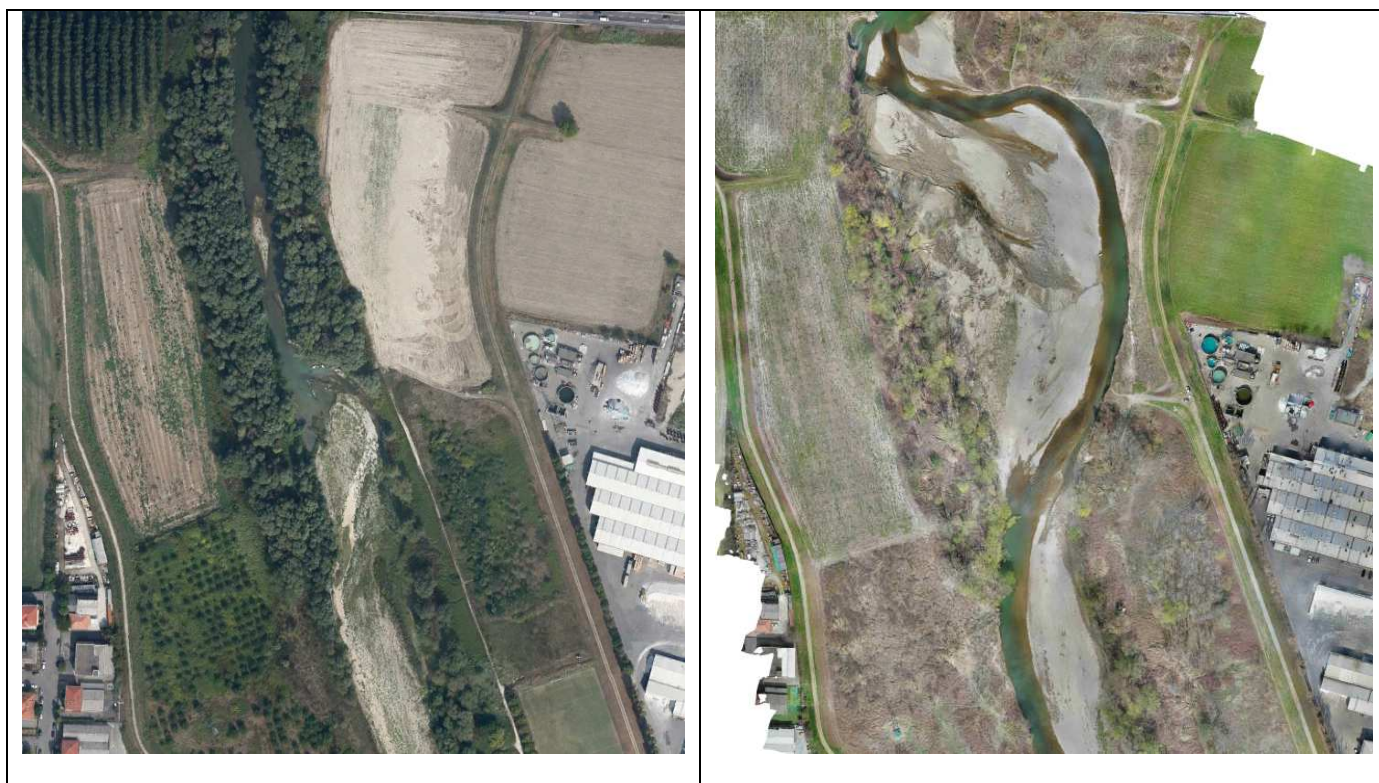
Figura 1 Confronto foto aeree anni 2012-2021 del tratto di t. Parma interessato dall'intervento

Nell'ambito del presente intervento si è potuto disporre di una foto aerea, ricavata tramite volo con drone, aggiornata al marzo 2021 dalla quale è possibile evidenziare l'arretramento spondale avvenuto a seguito degli eventi di piena che si sono succeduti nell'autunno-inverno 2020-2021.